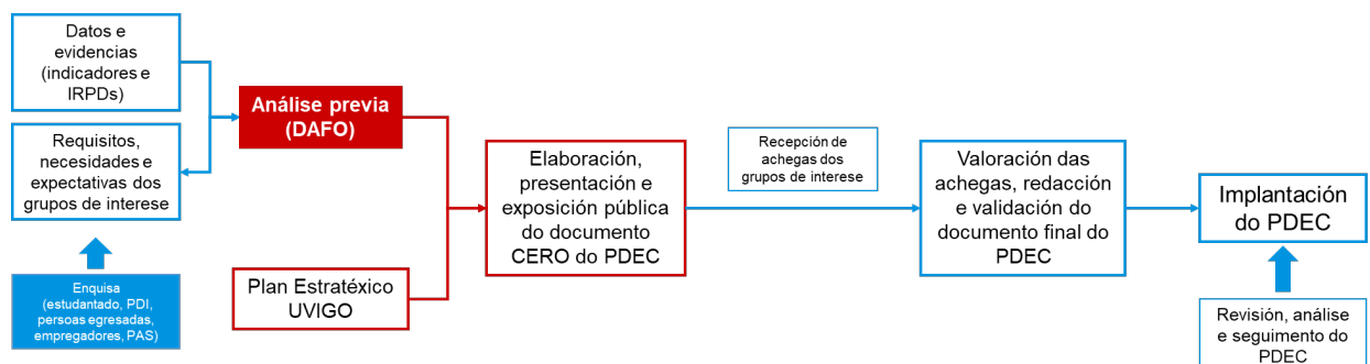
Figura 1. Esquema da estrutura e planificación do traballo na elaboración do PDE da Escola de Enxeñaría de Minas e Enerxía

Indícase a continuación a estrutura e planificación de traballo na elaboración, implantación e revisión do PDE do centro (PDEC).