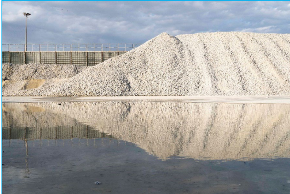
Fotografía gañadora do Primeiro Premio do Concurso de Fotografía ENFOCA.RME 2023